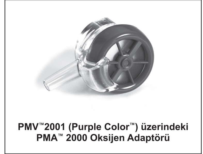
PMV™ 2001 (Purple Color™) üzerindeki PMA™ 2000 Oksijen Adaptörü