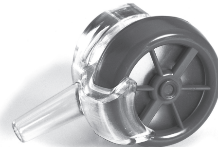
PMA™ 2000 iltadapter på PMV™ 2001 (Purple Color™)